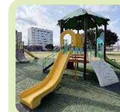
幼児遊具 ・3歳～6歳用・