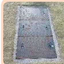
飲食イベントで効果を発揮する 汚水処理機能を備えた グリーストラップを2箇所完備