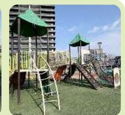
児童遊具 ・6歳～12歳用・